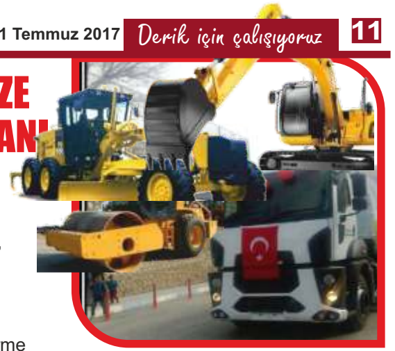
miştir. Önümüzdeki günlerde siz değerli halkımızın hizmeti için 1 adet yükleyici Loder satın alınacaktır.

*1 Adet silindir, *1 adet yol süpürme aracı, *1 adet cenaze aracı, *1 adet greyder, *1 ekskavator Ayrıca Çevre ve Şehircilik Bakanlığı 1 adet yol süpürme aracı ve 1 adet vidanjör hibe edilmiştir. Yine belediyemizin ihtiyaçları karşılması amacı ile 1 adet DMO'dan kendi imkanlarımız ile 1 yol süpürme aracı temin edil-