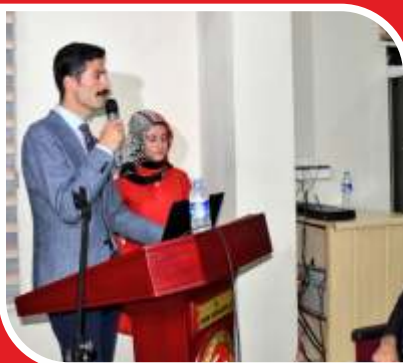
15 Temmuz Şehitlerini Anma, Demokrasi ve Milli Birlik Günü etkinlikleri kapsamında konferans ve paneller düzenlendi.