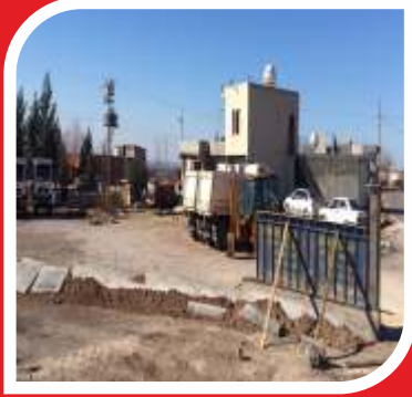
Mahallesi'nde bulunan depo görünümü. Garajın bakımsız olduğu ve güvenlik açığı bulunduğu tespit edilmiştir.

B elediyemiz Fen İşleri bünyesinde bulunan mevcut araçların ve iş makinelerinin yetersizliği model olarak eski olması gibi nedenlerden dolayı Belediyemizin hizmetleri aksaklıklar yaşamaktadır. Bu gibi sorunlardan dolayı Belediyemiz istenilen hizmeti vermekte zorlanmakta ve çoğu zaman yetersiz kalmaktadır. Belediyemizin hizmet araçlarının daha iyi hizmet verebilmesi adına araçlar ve alana ihtiyaç vardır. Tepebağ