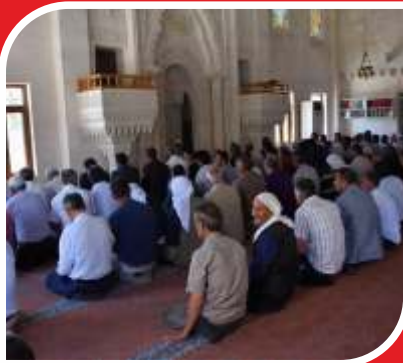
Tacarlar Camiisinde Aziz Şehitlerimiz için Mevlidi Şerif okundu ve vatandaşlarımıza yemek ikram edildi.