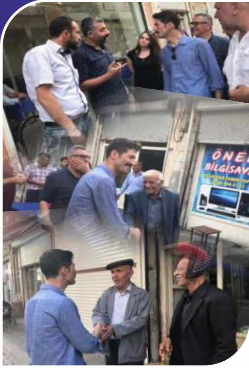
Esnafları sık sık ziyaret ederek istek, beklenti ve sorunlarını dinleyen Sayın Kafkas, alışveriş yapan halkla da sohbet etti.

İlçe Kaymakamı ve Belediye Başkan Vekilimiz Sayın Hakan KAFKAS, esnaflarımız ve vatandaşlarımızla bir araya gelerek sorunlarını dinlediler. Derik esnafını tek tek ziyaret eden Başkanvekilimiz Sayın Hakan Kafkas, işletme sahiplerinin sorunlarını dinledi ve çözüm önerilerini aldı.