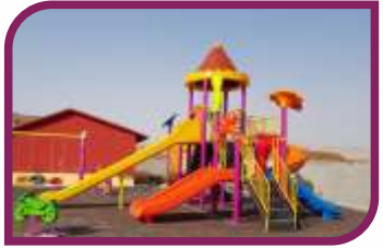
51 çocuk parkını tamamladık.