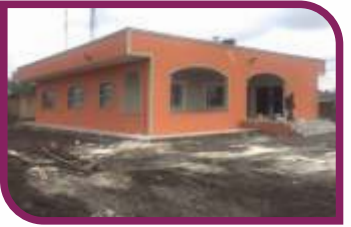
Planladığımız 10 taziye evinden 9'unu tamamladık.