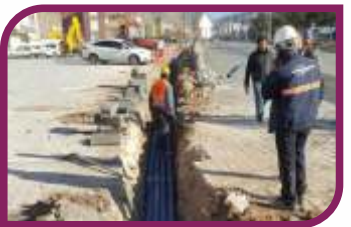
Elektrik şebeke-ini yer altına indiriyoruz.

D erikli hemşehrilerimizin yaşam standartları yüksek, huzurlu ve güvenli bir ortamda yaşamlarını devam ettirmelerini sağlamak; daha gelişmiş, altyapı ve çevre sorunlarının giderildiği bir Derik yaratmak amacıyla gerek esnaflardan gerekse hemşehrilerimizden