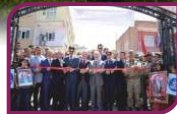
Parklarımız bir bir hizmete giriyor.