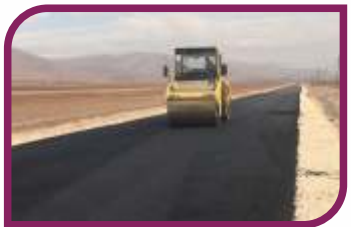
603 km'lik yol ağımdan 206 km'sini asfaltladık.

Derik Belediyesi olarak uzun yıllara sığacak hizmetleri bir yılda hayata geçirerek vaat ettiğimiz çalışmaların % 90'ını tamamladık.