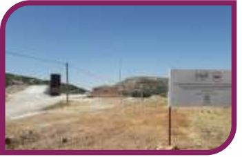
Çöp Aktarma İstasyonunu hizmete aldık.