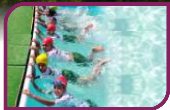
Gençlerimize ve çocuklarımıza özel projeler hazırladık.