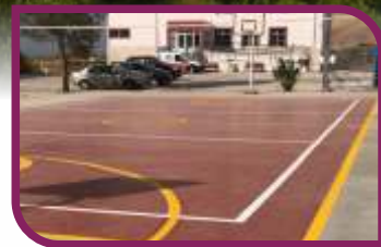
25 okulumuza spor sahası yaptık, 27 okulumuzu ise onardık.