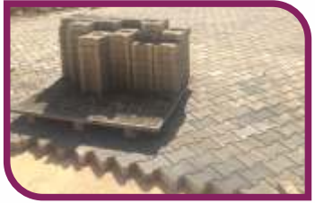
110 bin m2 kilitli parke taşı döşedik.