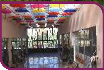
Kadınlarımız için Kadın Geliştirme Merkezini açtık.